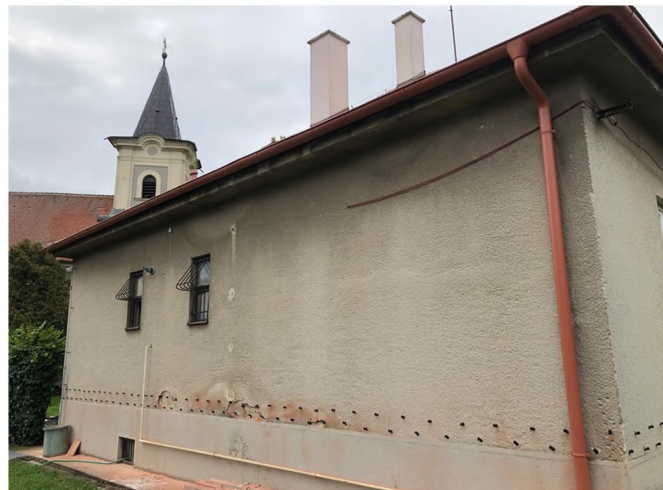
Farský úrad v lehote pri Nitre Realizácia: 1955 - 1960