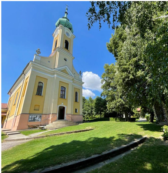
Farský kostol sv. Jána Nepomuckého Lukáčovce Realizácia: 1792

Zhotoviteľ: ELCOP, s.r.o., Piesková 1153/14, 949 01 Nitra